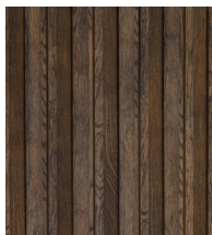
Ciemny dąb - MCB320A