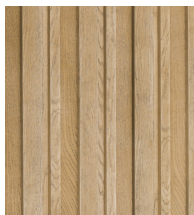
Złoty dąb - MCB320G