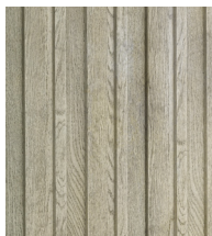
Dąb dymiony - MCB320D